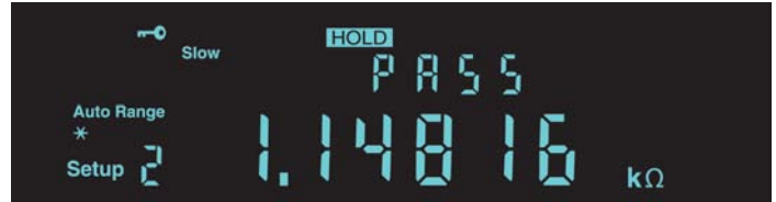
Limit compare mode on the DMM4020.

Dedicated front-panel buttons provide fast access to frequently used functions and parameters, reducing setup time. You no longer need to search through software menus to find the function you need.