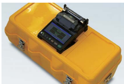
Кейс в качестве монтажного столика