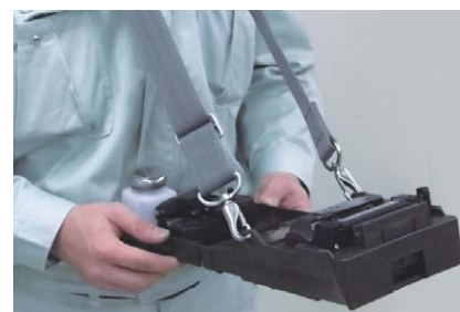
Работа в труднодоступных местах

В памяти аппарата Fujikura 12S стандартно прошито 100 заранее настроенных режимов сварки и 30 режимов термоусадки, параметры которых можно при необходимости изменять. Производство аппаратов осуществляется в Японии. Кроме того, сварочный аппарат Fujikura 12S русифицирован .